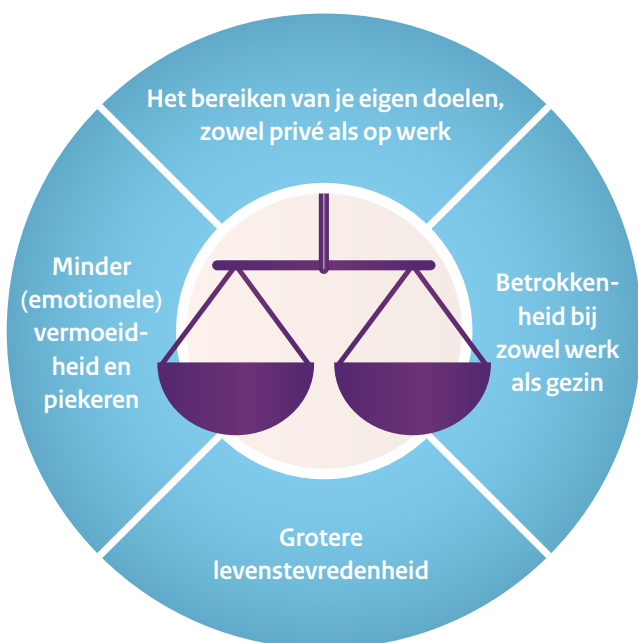
Een goede werk-privébalans